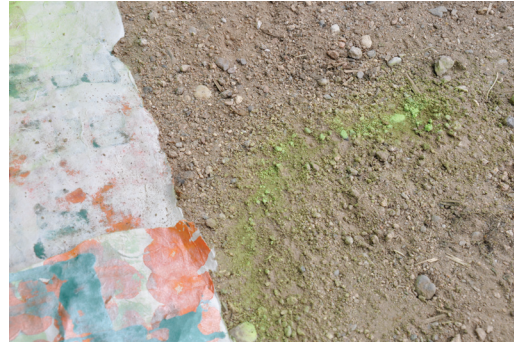
Bild 1 und 2 Sprayen